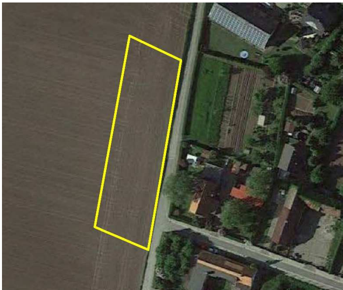
Luftbild des Plangebietes

Die Außenbereichsflächen, die in den Innenbereich einbezogen werden sollen, haben eine Größe von ca. 2.587 m 2 . Der Geltungsbereich umfasst einen Streifen von 30 Meter Tiefe am Ostrand der Flurstücke 346/120, 325/121, 326/121 und 244/122 der Flur 10, Gemarkung Kroppenstedt. Die Einbeziehungssatzung schließt östlich an die Straße Lindengarten an und umfasst eine Grundstückstiefe von ca. 30 Metern.