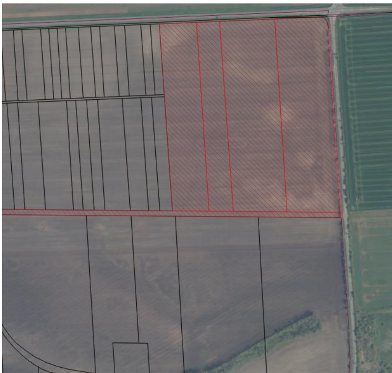
Auszug aus CAIGOS Flur 12