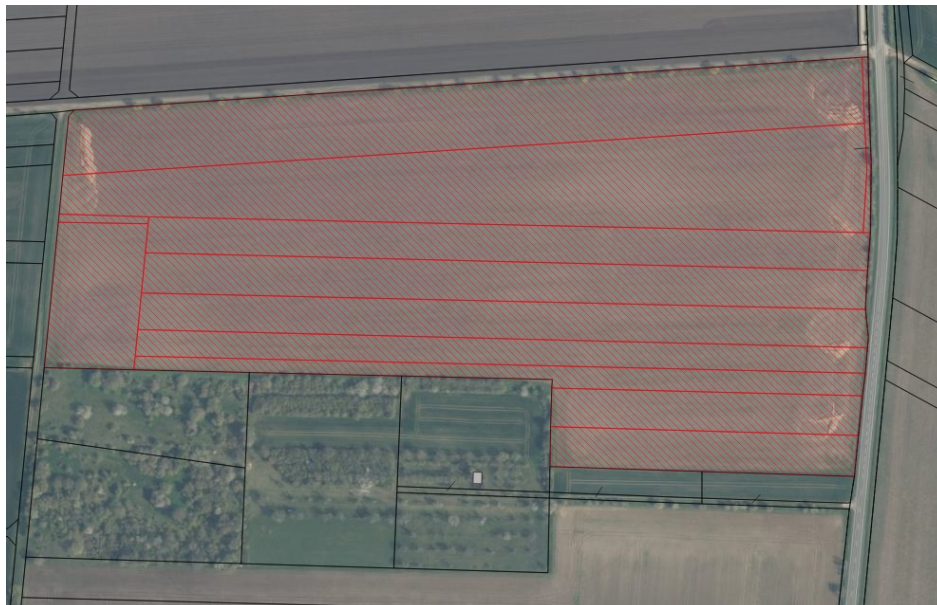
Auszug aus CAIGOS, Flur 9